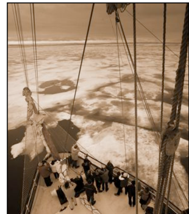
Geographische Reisegesellschaft Sporksfield 93, D-48 308 Senden Telefon: 02536-34 35 69 2 info@geo-rg.de, www.geo-rg.de