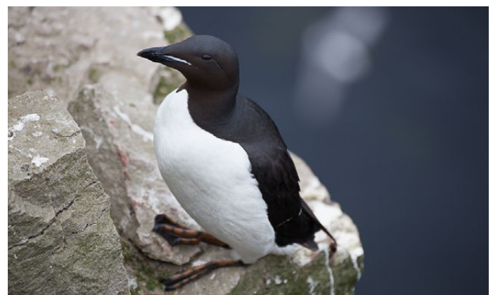
Die Geographische Reisegesellschaft Sporksfeld 93, D- 48 308 Senden Tel: 02536/3435692, info@geo-rg.de , www.geo-rg.de